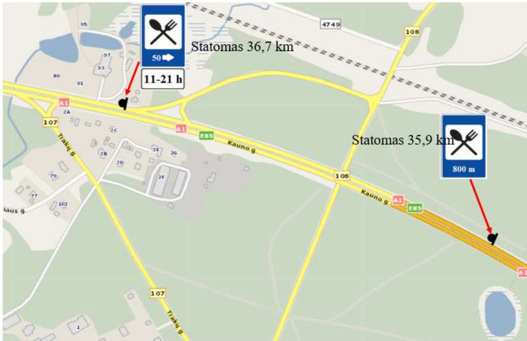
Kelio A1 Vilnius–Kaunas–Klaipėda 35–37 km kelio ženklų pastatymo schema.

Kontaktai: įmonės pavadinimas, adresas; atsakingo asmens vardas, pavardė, telefono numeris.