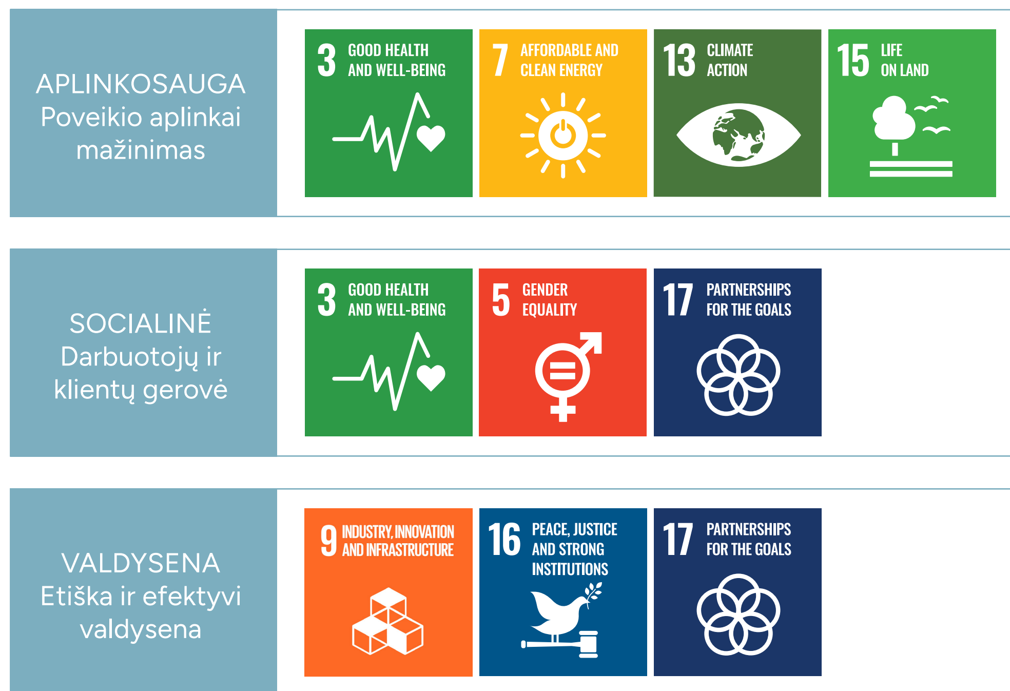
1 pav. Bendrovės tvarumo kryptių sąsaja su Jungtinių Tautų Darnaus vystymosi tikslais

Į strateginių tikslų žemėlapyje integruotos tvarumo kryptys ir veiklos sritys, įvertintos kaip svarbios Bendrovei dvejopo reikšmingumo vertinimo metu (1 pav.)